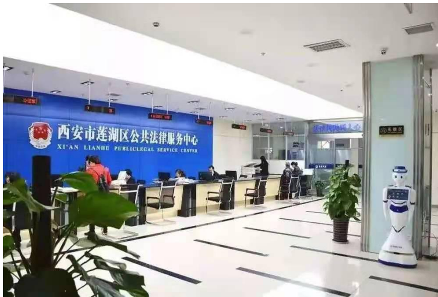
（莲湖区公共法律服务中心大厅）

五是切实加强政府信息管理、提升公开平台建设管理水平、加强监督保障。普法与依法治理科落实专人负责政务公开工作，对区政府门户网站实行每日监测，及时更新栏目信息，确保了网站长期安全、稳定运行，进一步提升群众获取政府信息的便捷性。